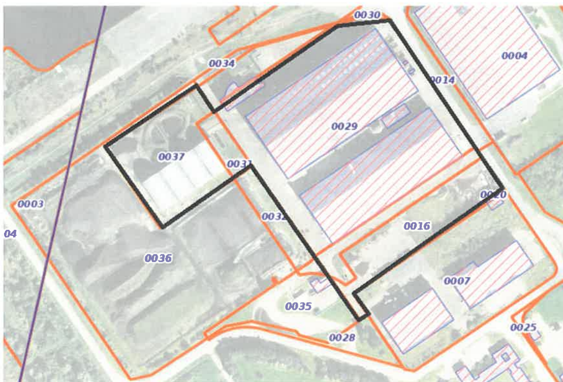
Parcelles concernées incluses dans le périmètre noir